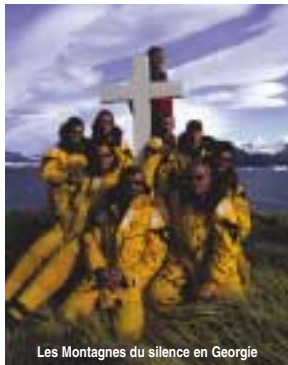
Les Montagnes du silence en Géorgie

Novembre 2004 marquera le départ de l'expédition « Endurance ». Réunissant une équipe de sourds et d'entendants, cette première grande aventure de l'association « Montagnes du Silence » part, depuis les îles Falkland jusqu'en Géorgie du Sud, sur les traces de Sir Ernest Shackleton, personnage emblématique de la conquête des pôles.